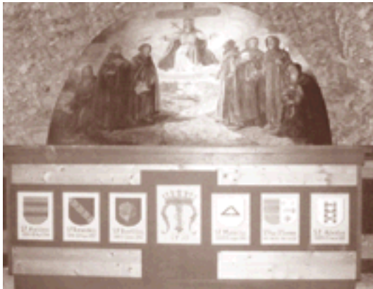
Der restaurierte Altar in der Sieben-Väter-Kapelle

und Wege wurden Aussichtsplätze, Andachtsstätten sowie ein Kreuzweg errichtet, Grotten wurden zu Kapellen umgestaltet. Der Weg um den sogenannten Residenzberg, der hinter der Servitenkirche beginnt, trägt heute noch den Namen „Galitzin-Steig“. Im 19. Jahrhundert war die Anlage weithin berühmt und wurde von den Zeitgenossen als einzigartig beschrieben. In den vergangenen Jahrzehnten in Vergessenheit geraten, waren auch die einzelnen Stationen des Weges dem Verfall