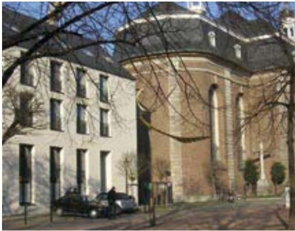
Das Stadtkloster der Servitinnen (2. und 3. Etage) im Haus neben der Maxkirche

ein Symbol für zündende Impulse, die von diesem Ort ausgingen, und als Symbol für den Auftrag, den wir alle mitnehmen, das Feuer weiterzutragen, mit dem Segen Gottes ein „Feuerwerk“ des Glaubens und der Hoffnung in dieser Stadt zu entzünden.