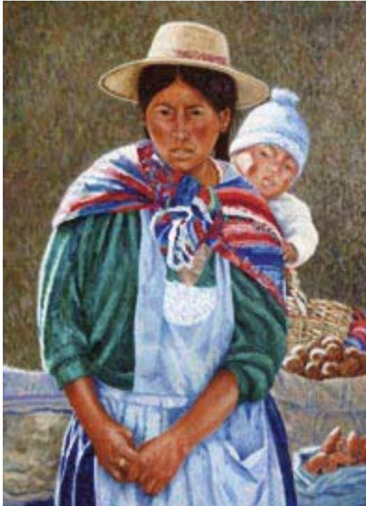
Bolivianische Frau mit Kind; Gemälde von fr. Giovanni Battista M. Pesci OSM (16 Jahre Missionar in Bolivien)

kurse werden in verschiedenen Sektoren von Oruro und mit verschiedenen Bevölkerungsschichten regelmäßig durchgeführt. Im psychologischen Bereich wird Orientierung über die Folgen der Gewalt, Begleitung und Betreuung von Opfern auf individueller