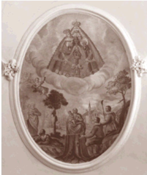
Deckenfresko in der Wallfahrtskirche: Auffindung des Gnadenbildes

den folgenden Kriegsjahren heimlich nach Neuwied und Andernach in Deutschland in Sicherheit gebracht. Genauso verborgen, ohne Wissen der französischen Besatzungsmacht, kehrte es zunächst am 10. Oktober 1945 nach Tirol zurück. Am 1. Juli 1945 wurden die Wallfahrtskirche und das Kloster vom Orden wieder übernommen. Da das Gnadenbild die Kriegsjahre nicht unbeschadet überstanden hatte (es war mehrmals vergraben), wurde es zunächst restauriert. Am 11. November 1945 kehrte