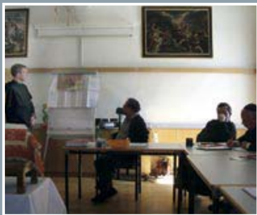
Eindrücke vom Provinzkapitel auf Maria Waldrast (12.-16. März 2007)